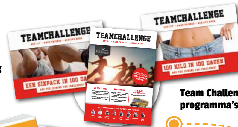
Team Challenge programma's